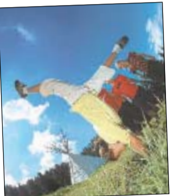
Die Welt steht Kopf im Indianerdorf.

Aber auch bei Einheimischen ist der Taser sehr beliebt, nicht nur wegen der hausgemachten Kuchen. Die Alm ist ein idealer Ausgangspunkt für Wanderungen rund um den Meraner Hausberg, den Ifinger. (ki)