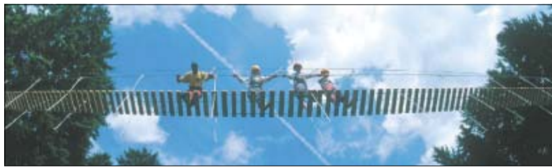
Ausblicke, die den Atem rauben: ob auf der Hängebrücke im Hochseilgarten (Bild oben), am Gipfel des Meraner Hausberges Ifinger (B. links) oder von der Alm auf das Wolkenmeer über dem Meraner Talkessel (B. rechts). Nicht umsonst ist der Taser eines der beliebtesten Ausflugsziele im Burggrafenamt.