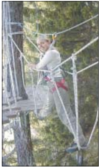
Abenteuer pur: Kraxeln in einem der schönsten Hochseilgärten Südtirols (nur nach Voranmeldung).